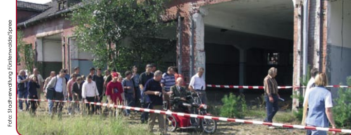
Fürstenwalde/Spree, Tag der offenen Konversionsfläche 2005.