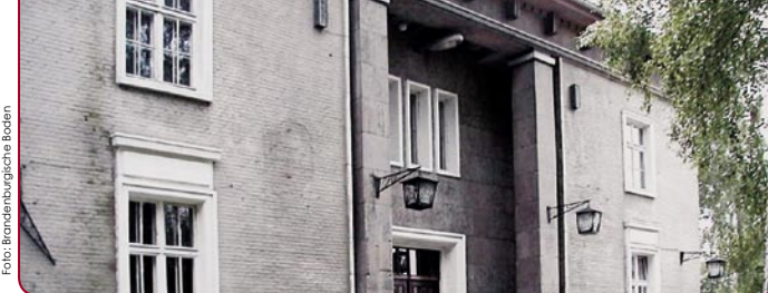
Potsdam, Kaserne Krampnitz. 113 ha sind noch zu entwickeln.