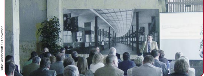
Erstal, Olympisches Dorf. Eröffnung des Konversionsssommers 2006.